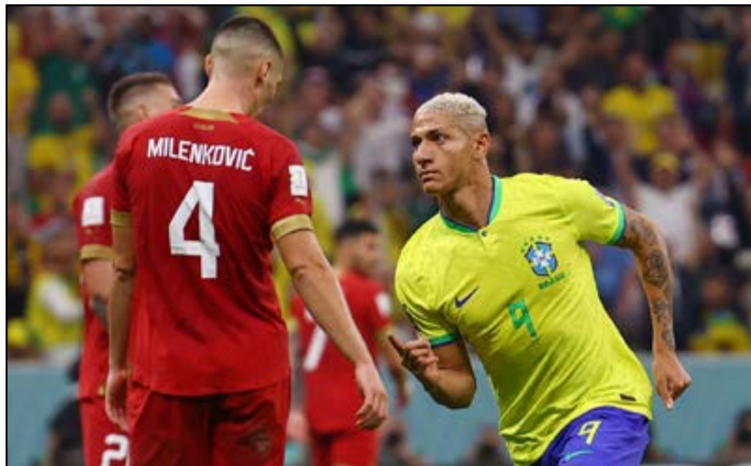
Richarlison marcou duas vezes na estreia do Brasil no Mundial

G, a equipe brasileira espera manter os 100% de aproveitamento e realizar um Mundial sem sustos. O Brasil encerra sua participação na fase de grupos contra o Camarões na sexta-feira, 02 de dezembro, às 15h (de MS), no Estádio de Lusail. Com informações do Correio Braziliense e O Lance.