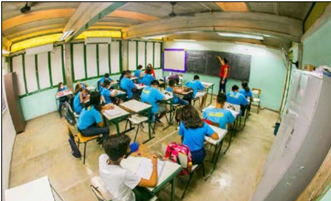
Rematrícula garante a permanência do estudante na mesma escola ou em outra unidade da Reme

Pais e responsáveis de estudantes matriculados em algumas das unidades escolares pertencentes à Rede Municipal de Ensino (Reme) já podem realizar o processo de rematrícula 2023. A ação garante a permanência do estudante na mesma escola ou em outra unidade da Reme, desde que a atual não ofereça, no próximo ano, a série subsequente no Ensino Fundamental.