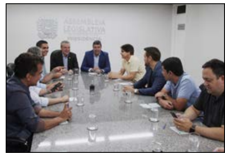
Diversos deputados participaram da reunião com o governador eleito

O novo governador tomará posse no dia 1º de janeiro em solenidade que será realizada na Assembleia Legislativa. Tradicionalmente, a faixa de governador é colocada em evento na governadoria. Mas, dessa vez, de acordo com Paulo Corrêa, esse ato