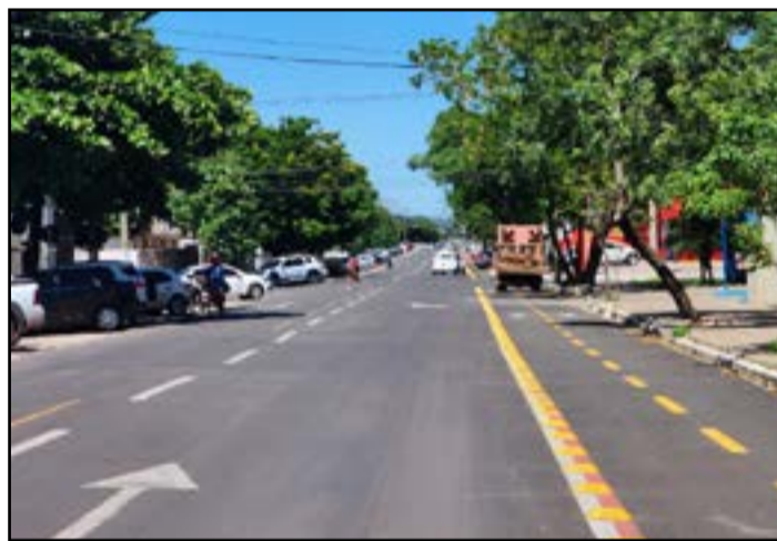
Tráfego é apenas no sentido rua Albuquerque até a rua Edu Rocha

Passada uma semana de ações educativas, a Agetrat começou na quinta-feira, dia 24, a multar quem