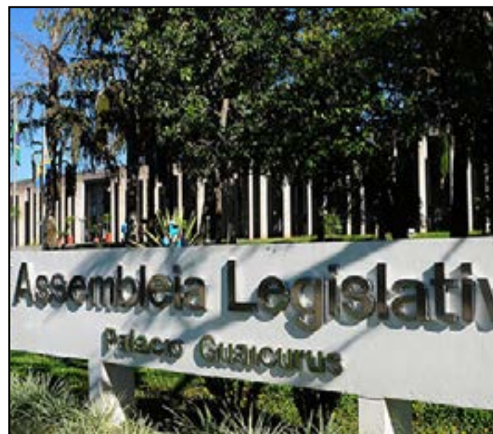
Projeto foi pauta de reunião realizada na ALEMS na semana passada

A proposta estabelece que as unidades regionais sejam compostas por agrupamento de municípios, limítrofes ou não. As informações são da Agência ALEMS.