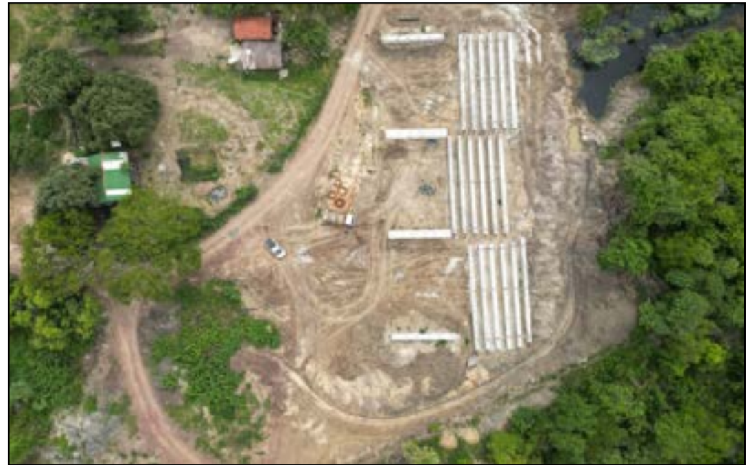
Novas estruturas de concreto vão contribuir com o acesso ao distrito de Porto Esperança (Agesul)

Desde 2015 foram mais de 100 pontes de concreto entregues pelo Estado, sendo que ainda continuam 24 obras em andamento e outras que vão iniciar até o final do ano. “Fizemos a opção por implantar pontes de concreto dentro do propósito do governo de reduzir custos com manutenção de