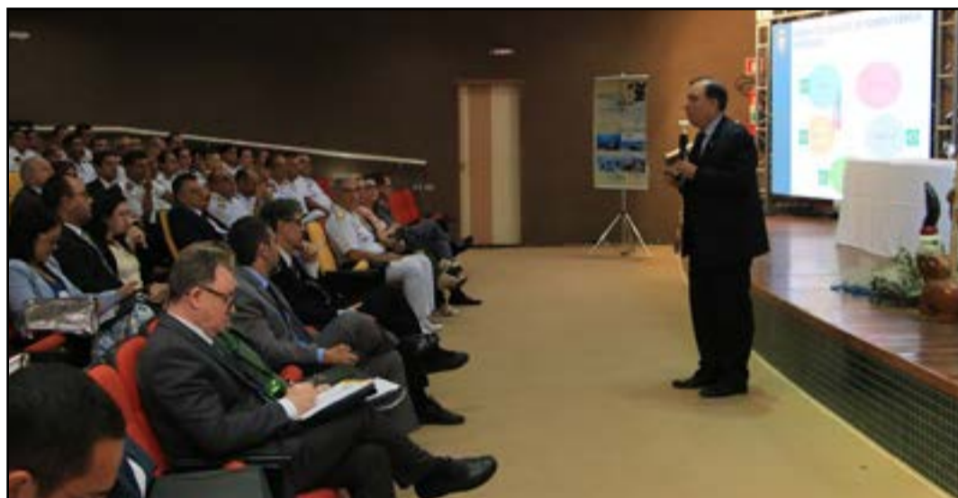
Evento fez parte das ações comemorativas aos 200 anos da Independência do Brasil

Durante a apresentação, o palestrante apresentou