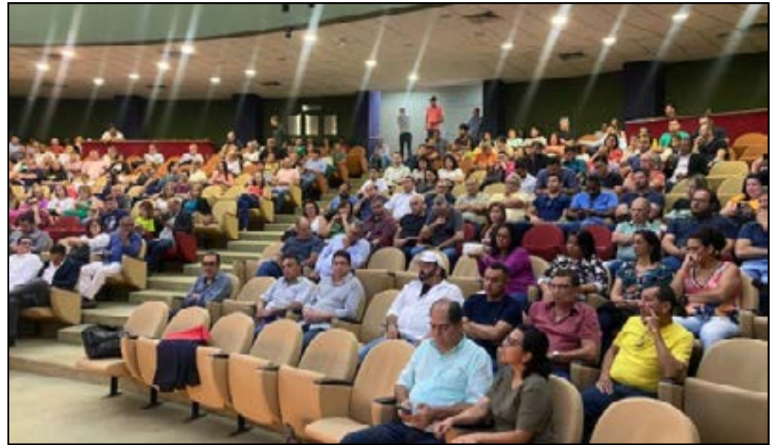
Evento esclareceu dúvidas dos gestores, conselheiros, responsáveis contábeis e controladores internos

No evento promovido pelo Tribunal de Contas do Estado de Mato Grosso do Sul, por meio da Escola Superior de Controle Externo (Escoex), em parceria com a Associação dos Institutos Municipais e Estadual de Previdência - ADIMP-MS, foram esclarecidas diversas dúvidas dos gestores, conselheiros, responsáveis contábeis e controladores internos. As informações são do TCE-MS.