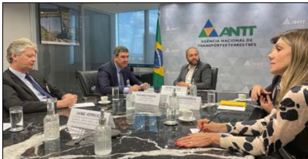
Governador discutiu projetos importantes ao MS

Em defesa do desenvolvimento do Mato Grosso do Sul, o governador Eduardo Riedel se reuniu na terça-feira (13) com o presidente da ANTT (Agência Nacional de Transportes Terrestres), Rafael Vitale, em Brasília. No encontro ele requisitou soluções céleres para relicitações da BR-163 e da ferrovia Malha Oeste. Ambas cortam o Estado.