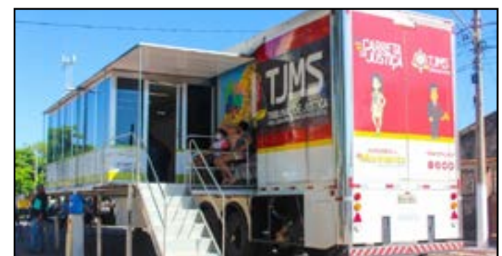
Serão dois dias de atendimentos