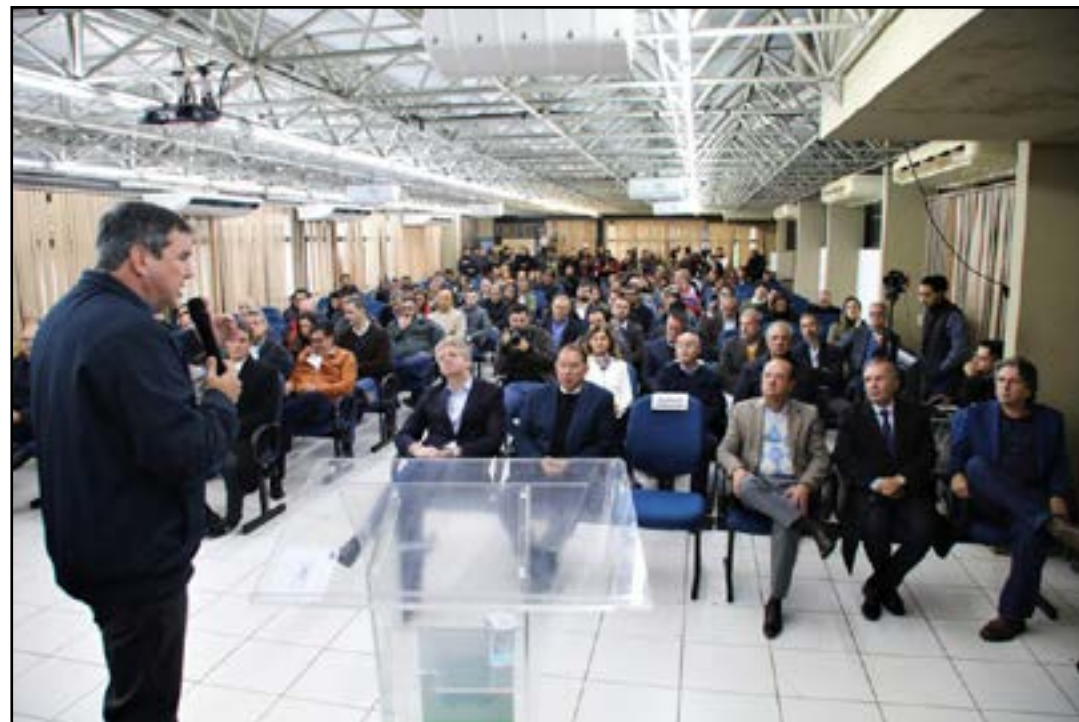
Governador assinou a sanção da lei

O plano ainda prevê a concessão de um vale-combustível de R$ 1 mil para os motoristas que fizerem as novas conversões. Com este valor o veículo poderá rodar até 3 mil km com a utilização de GNV. Este bônus será concedido pela MSGÁS por meio de um cartão com crédito, para abastecer com GNV. As informações são do Portal do Governo de Mato Grosso do Sul.