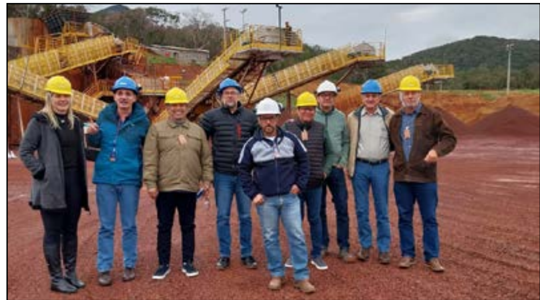
Visita aconteceu esta semana

"Essa é mais uma iniciativa muito importante