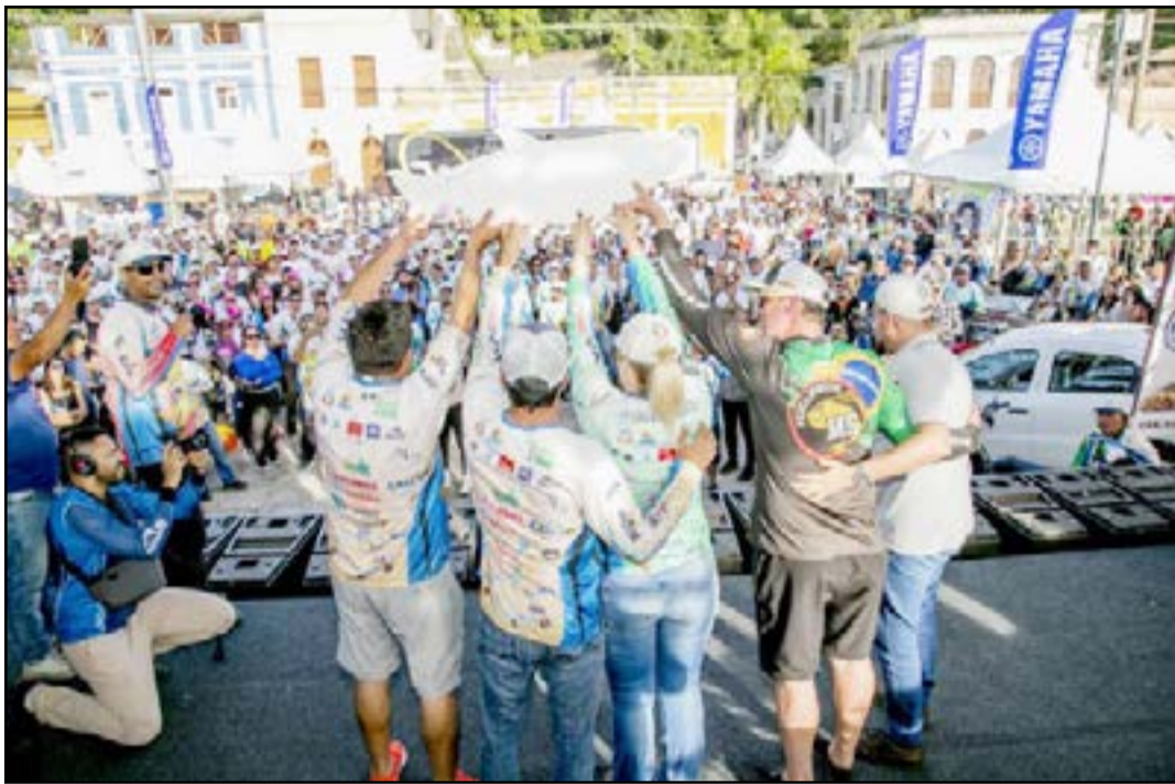
Festival de Pesca acontece em fevereiro

A abertura oficial do Festival Internacional de Pesca Esportiva de Corumbá (FIPEC) 2023 terá a apresentação da dupla promessa do sertanejo sul-mato-grossense. Kaio e Gabriel se apresentam no palco montado no Porto Geral na noite de 3 de fevereiro. O espetáculo é um oferecimento do Governo