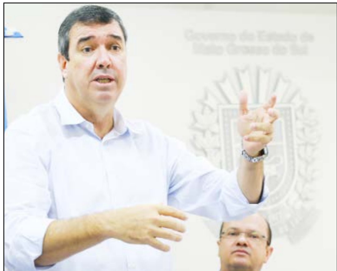
“A Rota Bioceânica é um sonho que está se tornando realidade”, diz Eduardo Riedel

Outro tema de responsabilidade federal apresentado pelo governador sul-mato-grossense foi a conclusão da UFN3. “Temos um ativo gigantesco que é a UFN3, que é da Petrobras, uma empresa que tem uma forte participação do Governo