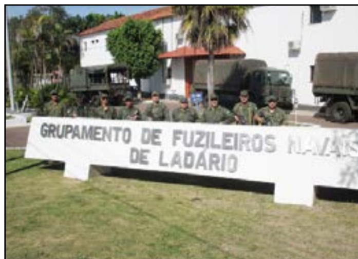
Estágio inicial deverá ser cumprido em uma das unidades da Marinha (6DN)

Abertas até 02 de março as inscrições para o concurso da Marinha do Brasil para admissão ao curso de formação de soldados fuzileiros navais para as turmas I e II de 2024. O curso de formação terá a duração de, aproximadamente, 17 semanas e será conduzido no Centro de Instrução Almirante Milcíades Portela Alves (Ciampa), localizado no Rio de Janeiro/RJ e, simultaneamente, no Centro de Instrução e Adestramento de Brasília (Ciab), localizado em Brasília/DF, sob regime de internato e dedicação exclusiva até a