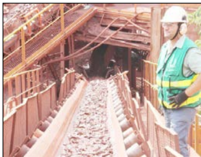
Proposta é de uma política mineral sustentável e de preservação ambiental

O setor de mineração ligado à extração de ferro e manganês, lidera investimentos em Mato Grosso do Sul com mais de R$ 5 bilhões previstos nos próximos dois anos, em exploração, ampliação e prospecção pela J&F, Vettori, 3A Mining SA e MPP Mineração. Além disso, o Estado ocupa a 7ª colocação na arrecadação nacional da CFEM (Compensação Financeira da Exploração de Recursos Naturais), com R$ 345,09 milhões recolhidos por meio das operações de 147 empresas instaladas em território sul-mato-