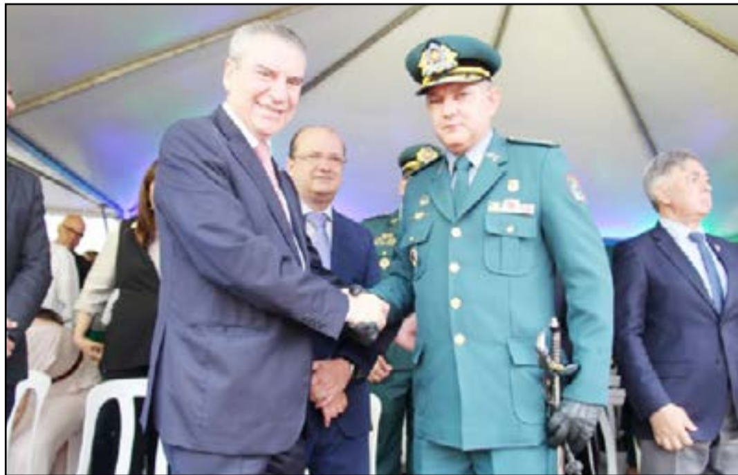
Presidente da ALEMS reitera a parceria com os segmentos que compõem a Segurança Pública do Estado