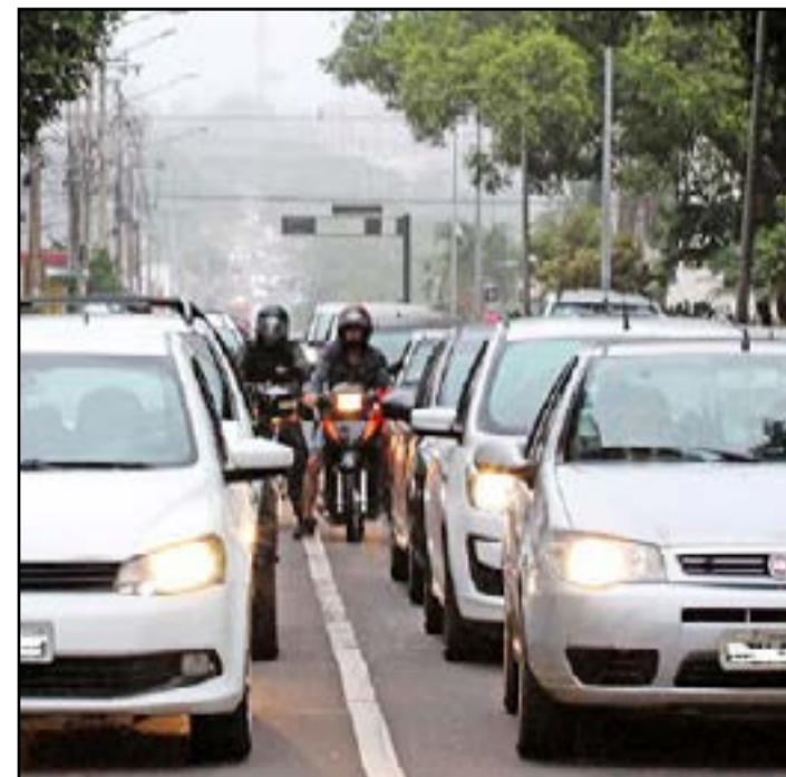
Data também é o limite para pagar primeira parcela

O Governo do Estado também já disponibilizou o calendário anula para o pagamento de licenciamento dos veículos. Para as placas de final 1 e 2 o vencimento será até o último dia de abril. Na placa com final 3 (maio), 4 e 5 (junho), 6 (julho), 7 e 8 (agosto), 9 (setembro) e 0 (outubro). As informações são do Portal do Governo de Mato Grosso do Sul.