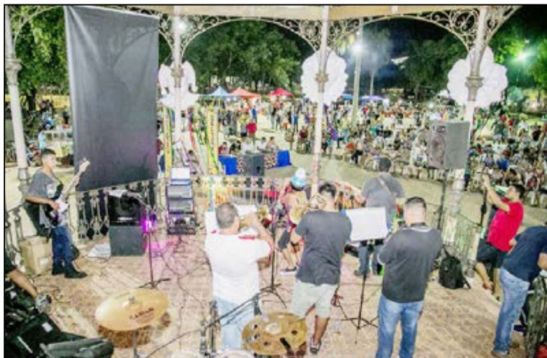
Cada participante poderá inscrever até duas músicas individualmente ou em parceria

Cada participante poderá inscrever até duas músicas individualmente ou em parceria. As inscrições são gratuitas e poderão ser feitas até o dia 06 de fevereiro de 2023, no Museu Casa do Dr. Gabi – Espaço de Memória