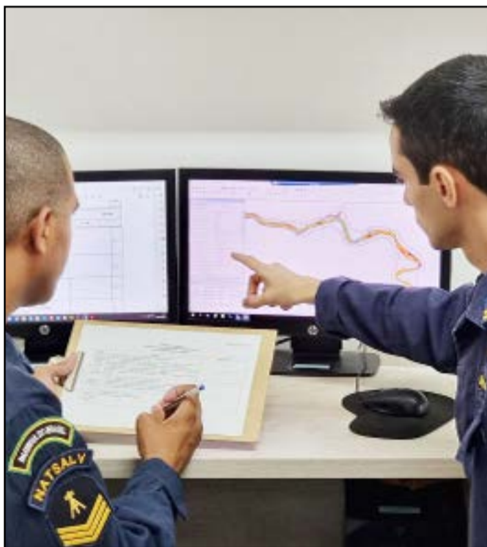
Operação de Banco de Dados Hidrográficos (6DN)

O Centro de Hidrografia e Navegação do Oeste (CHN-6), organização militar subordinada ao Comando do 6º Distrito Naval, recebeu a Certificação ISO 9001:2015, concedida pela empresa