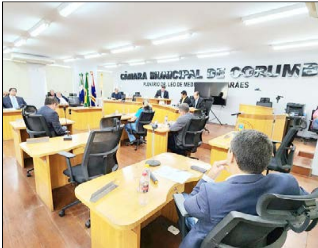
Câmara alterou Regimento Interno para antecipar fim de recesso