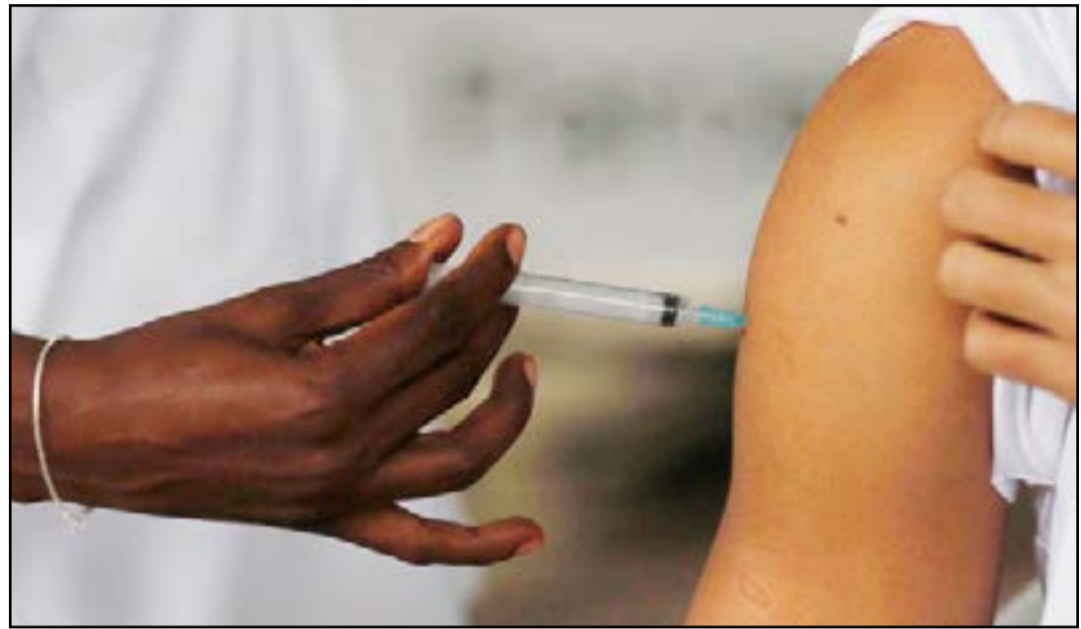
Na primeira fase, a campanha terá foco em pessoas com idade acima de 70 anos

“Destaco entre as medidas iniciais, a Política Nacional de Imunização, a ser apresentada; um plano nacional para redução de filas na atenção especializada; a recuperação da Farmácia Popular; a valorização da atenção básica; o provimento, qualificação e formação profissional; e a retomada em novas bases do Programa Mais Médicos”, disse a ministra. As informações são da Agência Brasil.