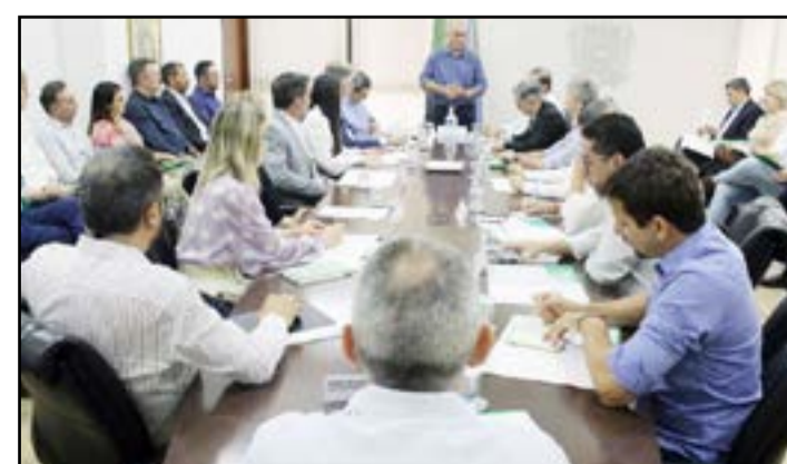
Reinaldo explicou que quer entregar o governo sem nenhum problema para o próximo gestor

Sobre o pagamento do funcionalismo no último mês do ano, o governador adiantou que além da folha de novembro e do 13º, ele fará a antecipação do salário de dezembro, que normalmente é quitado em janeiro. O pagamento do salário de dezembro será entre o Natal e o Ano Novo. As informações são do Portal do Governo de Mato Grosso do Sul.