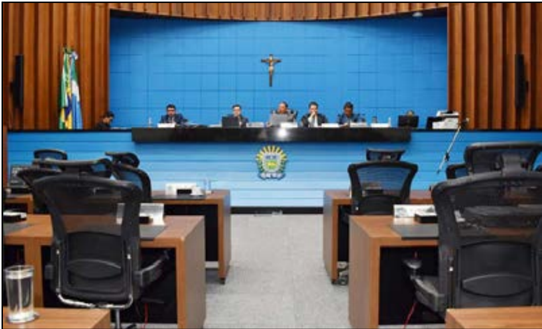
Projetos foram apresentados durante sessão