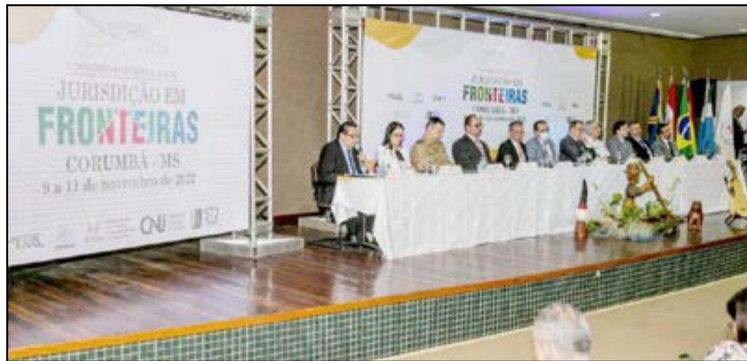
Congresso promoveu três dias de debates

“A fronteira passa a ser vista como um espaço de desenvolvimento estratégico e carecedor de políticas públicas específicas. Quando transportamos essa realidade para o Poder Judiciário, a condição fronteiriça impacta a jurisdição de várias formas, seja pela legislação nacional e internacional aplicável aos casos concretos, seja pela necessidade de interlocução e cooperação com outras instituições, também nacionais e internacionais. Cheguei em Corumbá em 2014 e estar inserida na