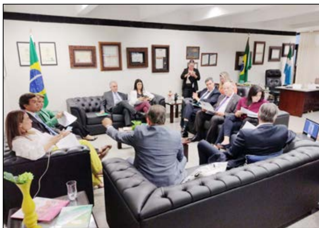
Reunião com bancada federal aconteceu em Brasília (Eduardo Santos)

Na área de infraestrutura, as emendas vão contemplar a rodovia MS-165, conhecida como Sul-Fronteira, dando continuidade ao investimento em Paranhos, com contrapartida de R$ 50 milhões do Governo do Estado; o Anel Viário de Três Lagoas; a BR-419 (de responsabilidade do DNIT) e o receptivo do Aeroporto de Dourados.