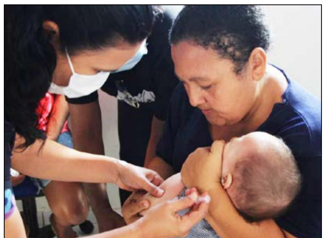
Na próxima semana, as doses estarão disponíveis nas salas de vacina das Unidades de Saúde

"É necessário o cadastro no site da Prefeitura, no portal da saúde, ou na própria unidade para que possamos planejar o próximo pedido", completou a secretária. O site é http://sisms.corumba.ms.gov.br/coronavirus/ . A Pfizer Baby é