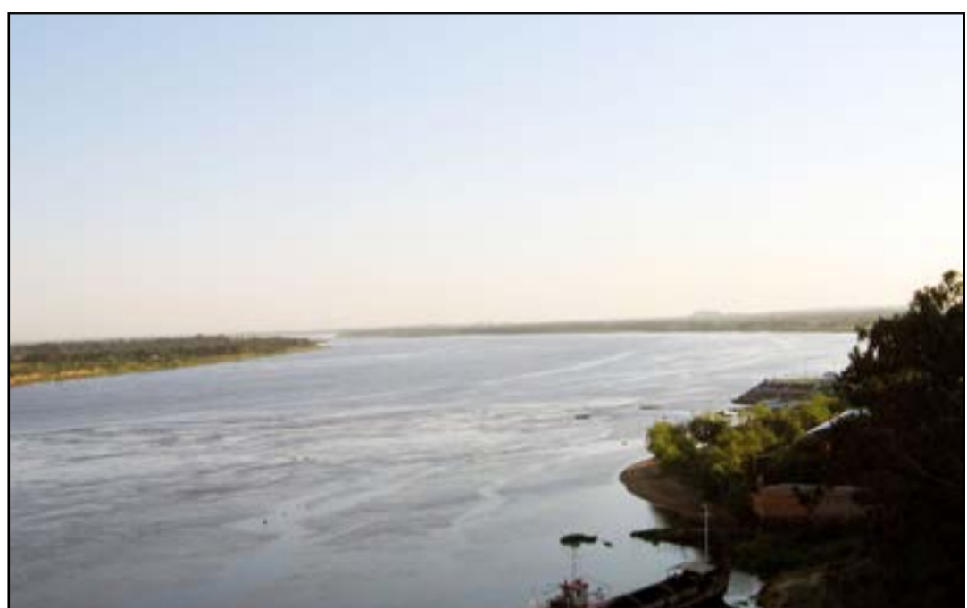
Superfície de água no Pantanal passou de 2,7 milhões de hectares em 1985 para 500 mil hectares em 2021

Em 1985, 4 milhões de hectares eram de campos alagados; em 2021, era 1,1 milhão de hectares.