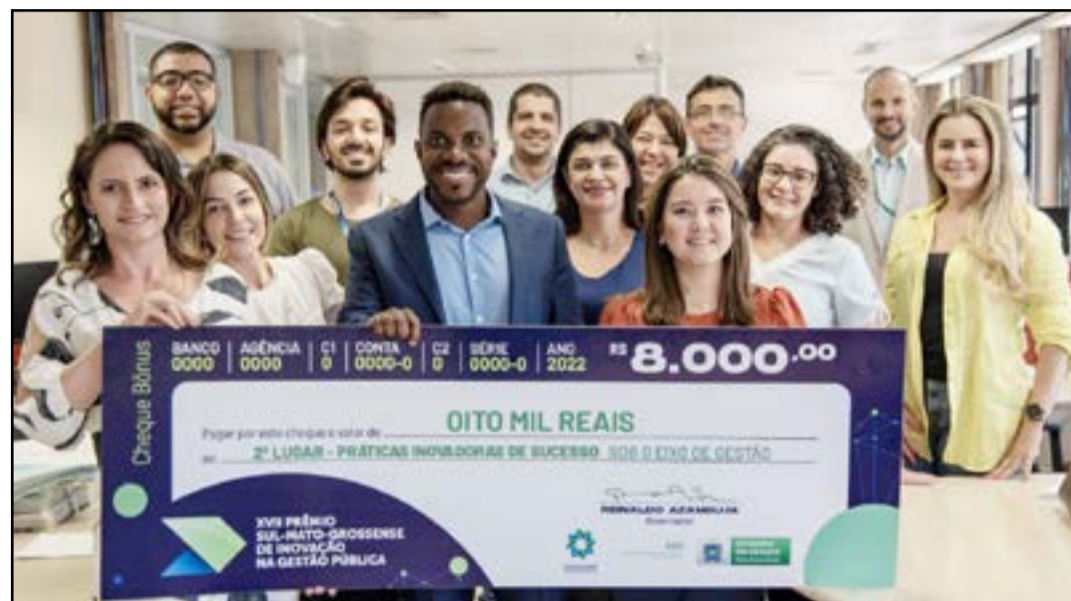
Projeto do TCE-MS recebe prêmio de Inovação na Gestão Pública

A metodologia de pesquisa de preços de medicamentos desenvolvida pelo TCE-MS foi reunida em uma cartilha disponibilizada para os jurisdicionados. São 11 passos detalhados em um