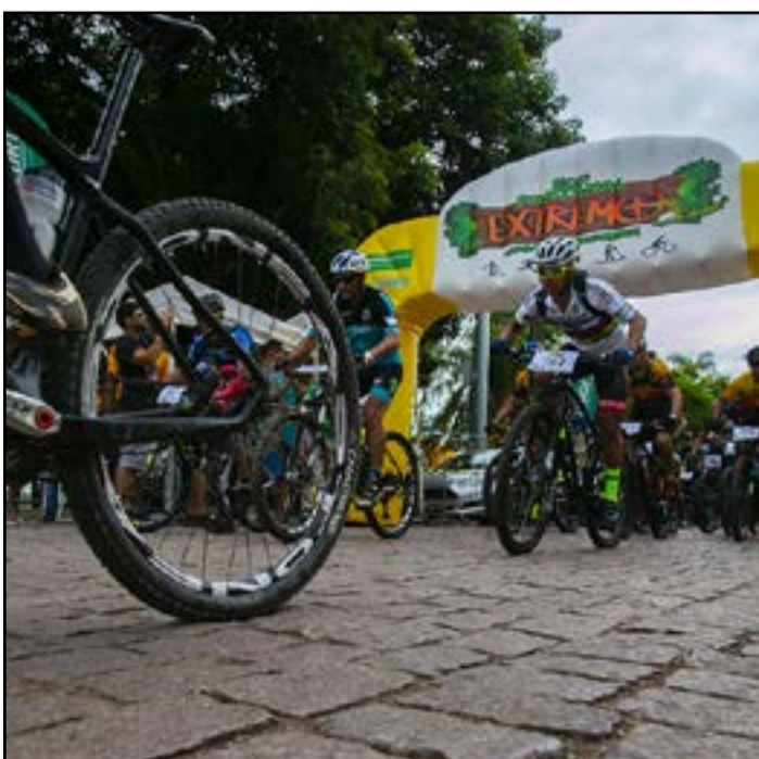
Evento começou na sexta-feira, dia 11

A Fundação de Esportes de Corumbá é coordenadora geral do Eco Pantanal Extremo 2022 – Jogos de Aventura.