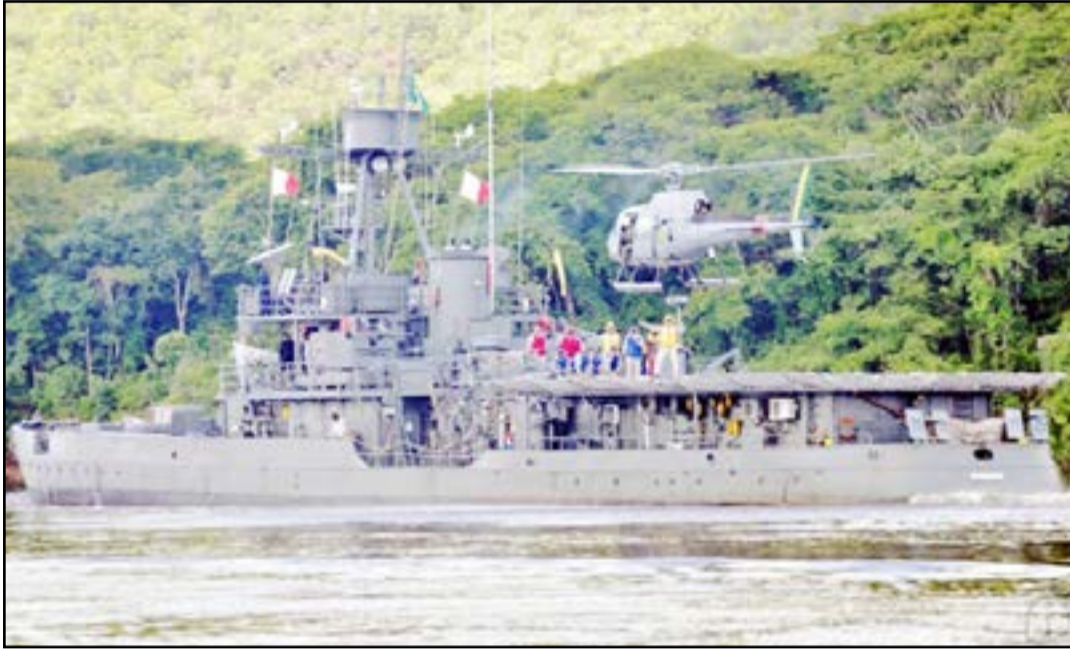
Monitor Parnaíba participou da 2ª Guerra Mundial

Às quinze horas do dia 06 de novembro de 1937, um navio, com projeto tão somente brasileiro, estava pronto no Arsenal de Marinha do Rio de Janeiro, marcando a retomada da construção naval no Brasil, no século XX. Naquela tarde, foi incorporado oficialmente à Armada brasileira, lançado ao mar e batizado como Monitor