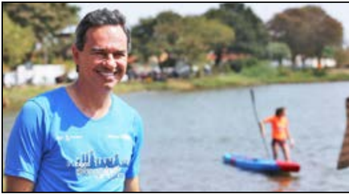
Marquinhos diz que vai criar programa Movimenta MS

O candidato do PSD ao Governo de Mato Grosso do Sul, Marquinhos Trad, promoverá bem-estar aos sul-mato-grossenses com estímulo a adoção de hábitos saudáveis. O Programa Movimenta MS levará atividades regionalizadas e inclusivas para que toda a população seja contemplada com eventos e competições, dentro e fora do ambiente