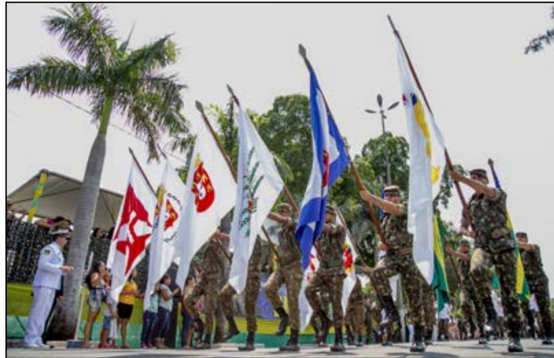
Desfile cívico-militar foi dividido em duas partes

Após a cerimônia de hasteamento da bandeira nacional teve início o desfile cívico-militar na avenida General Rondon. Dividido em duas partes, o desfile teve duração aproximada de 40 minutos. Na primeira delas, desfilaram as Forças Armadas e Forças Auxiliares. A apresentação militar contou com a Guarda das Bandeiras Históricas com os pavilhões adotados pelo Brasil desde a chegada portuguesa, em 1500, até a proclamação da República, em 1889. A passagem dos militares contou com representações da Marinha; Exército; Força Aérea; Polícia Militar, Corpo de Bombeiros e Guarda Civil Municipal. Os militares ainda