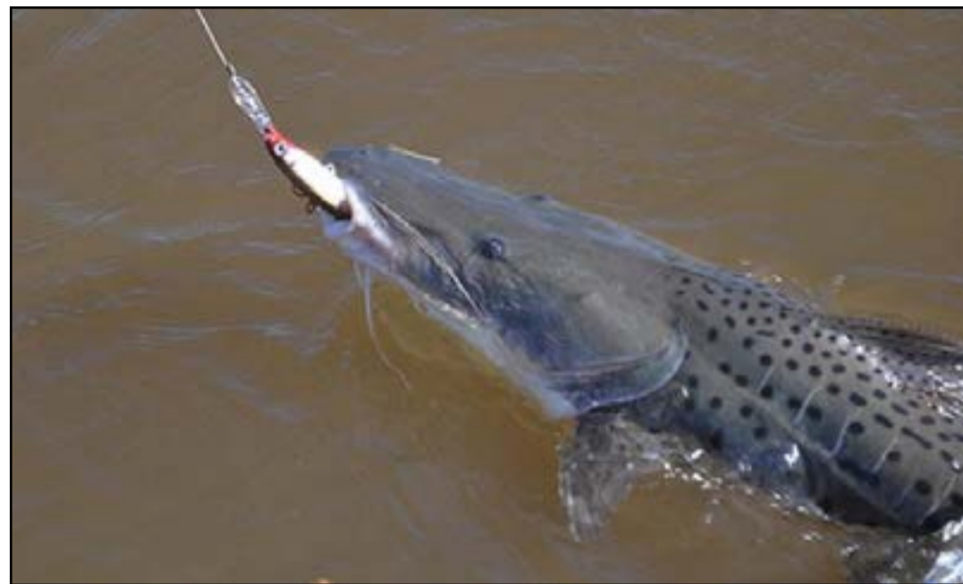
MS vai apresentar estudos comprovando que o pintado não é uma espécie ameaçada de extinção em suas bacias

a intermediação do governador Reinaldo Azambuja junto ao MMA também beneficia o mercado de pescado do Estado, especialmente os milhares de pescadores