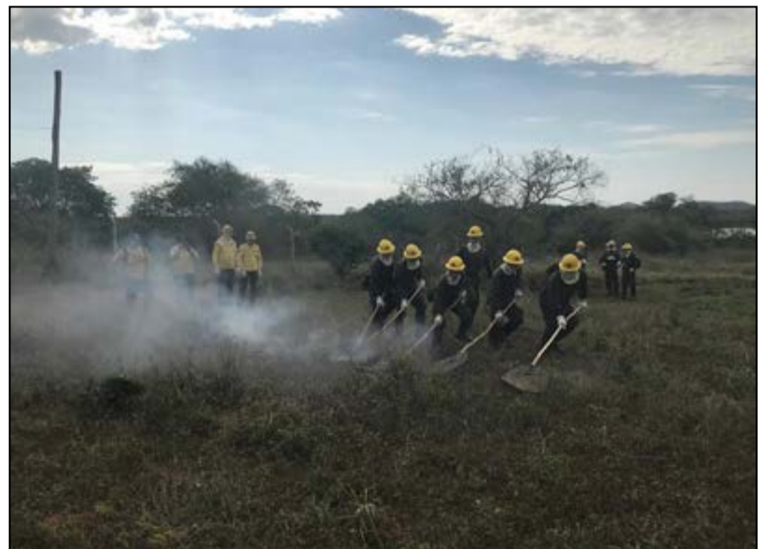
Foi a terceira turma participante do curso pelo 6º Distrito Naval

Quarenta militares do 3º Batalhão de Operações Ribeirinhas (3ºBtlOpRib) e dois do Comando da Flotilha de Mato Grosso (ComFlotMT) participaram, de 22 a 26 de agosto, do curso de combate a incêndios florestais com brigadistas do Centro Nacional de Prevenção e Combate aos Incêndios Florestais (Prevfogo), do IBAMA.