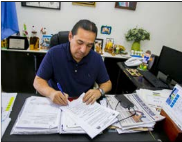
Prefeito sancionou lei com novas datas de vencimentos à vista do IPTU

O prefeito Marcelo Iunes sancionou a lei nº 2.847 estabelecendo novas datas de vencimentos à vista ou parcela (cota) única do Imposto Predial e Territorial Urbano (IPTU) e da Taxa de Serviços Coleta de Remoção de Resíduos Sólidos do exercício de 2022 (Corumbá em Dia com o IPTU). De acordo com a legislação, pagamento à vista com 20% (vinte por cento) de desconto pode ser solicitado e feito até 30 de setembro de 2022. Já o pagamento à vista com 15% (quinze por cento) de desconto, pode ser solicitado e realizado até 31 de outubro deste ano. O desconto não recai sobre taxa anual de coleta de lixo, somente no valor do imposto.