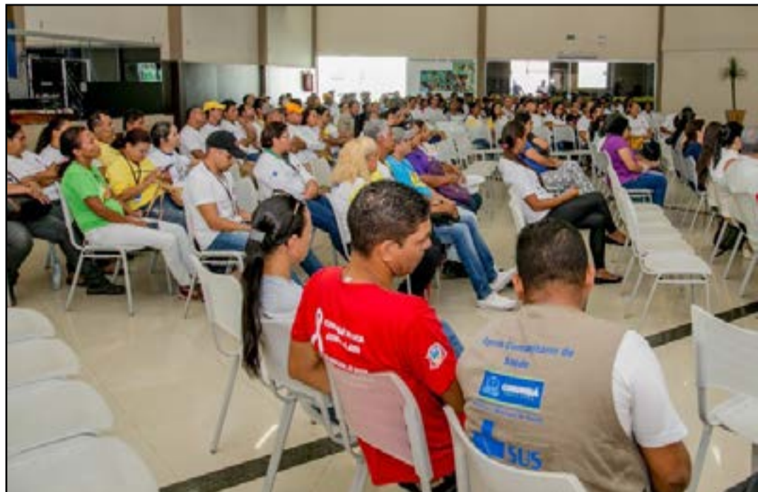
Projeto do Executivo valoriza agentes comunitários de saúde de Corumbá

Projeto de Lei encaminhado pelo Poder Executivo instituindo incentivo aos Agentes Comunitários de Saúde de até 50% do vencimento fixado para a Classe A, do nível I, da Tabela de Vencimento da Prefeitura de Corumbá, condicionado ao cumprimento de metas e produção, foi aprovado por unanimidade pela Câmara Municipal de Corumbá na sessão do dia 05 de setembro.