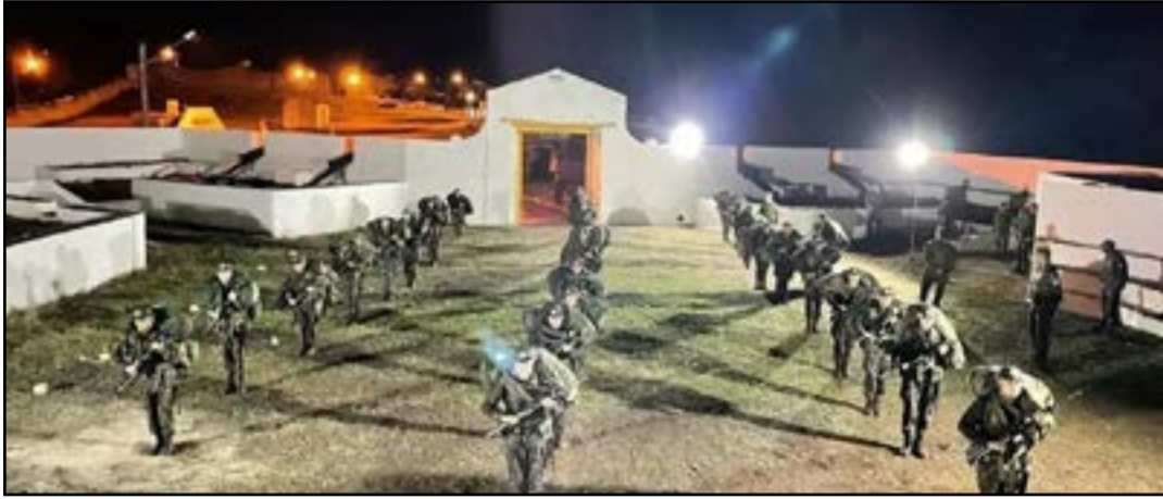
Estágio tem duração de cinco semanas, com 572 horas de instrução