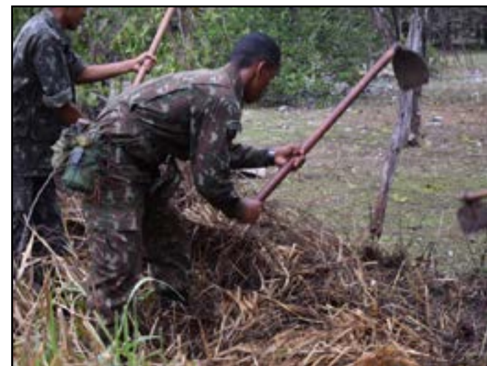
Capacitação foi ministrada pelo 3º Grupamento de Bombeiros Militar

Foram ministradas instruções de atendimento pré-hospitalar, operação e manutenção com motosserra, manutenção e manuseio de ferramentas, construção de aceiros, queima controlada em postagem e prática de combate a incêndio florestal. As informações são do 17º Bfron.