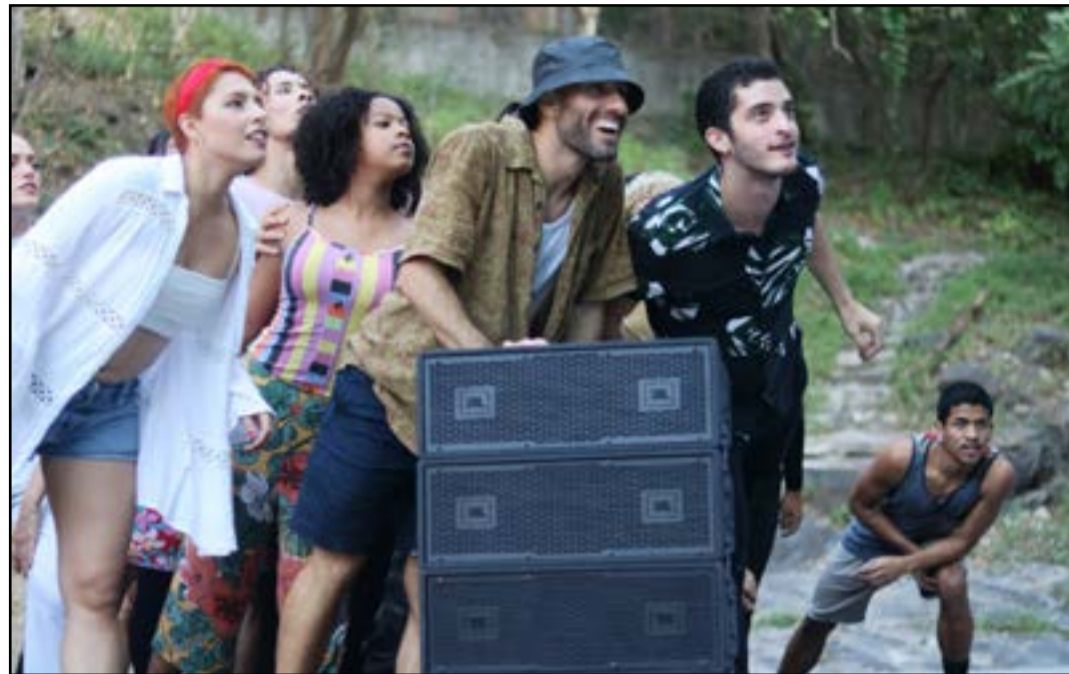
Edição do Dança em Trânsito será realizada até o dia 23 de outubro

O Dança em Trânsito é um dos mais longevos festivais de dança contemporânea do Brasil. O festival é apresentado pelo Instituto Cultural Vale, com realização e produção do Espaço Tápias, por meio da direção artística e curadoria de Giselle Tápias e Flávia Tápias. Desde 2002 acumula números superlativos, com cerca de mil apresentações em mais de 30 cidades, no Brasil e no exterior, envolvendo uma centena de companhias oriundas de 16 países, vistas por mais de 60 mil pessoas.