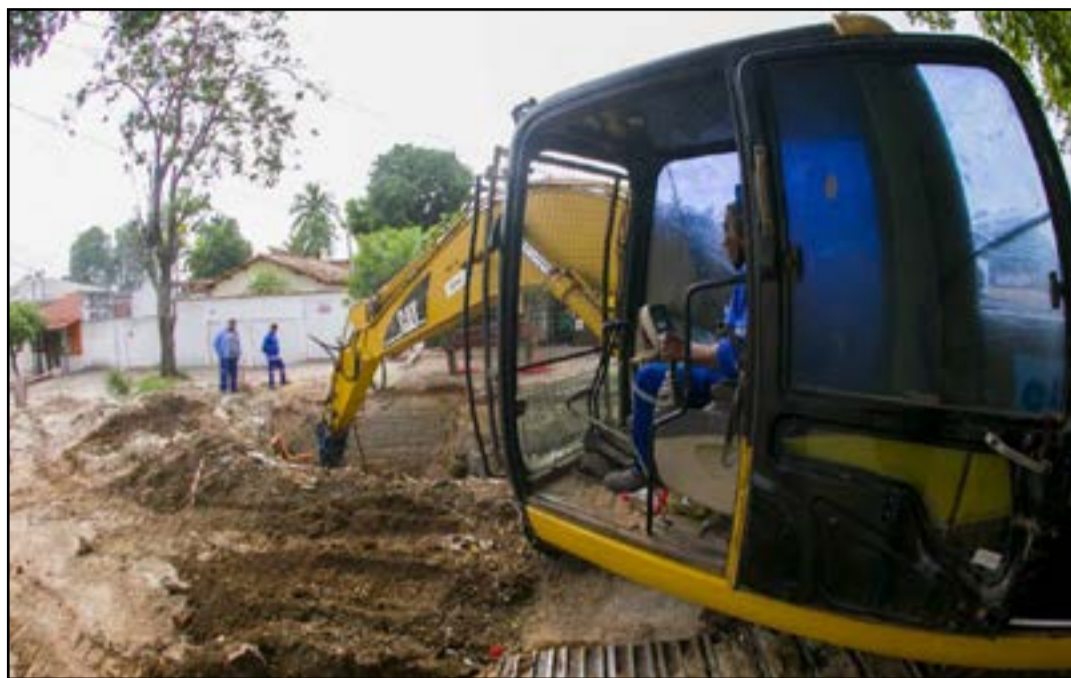
Obras estão concentradas na rua Luiz Feitosa, esquina com rua América

“São serviços importantes e que vão dar qualidade de vida para os corumbaenses. Isso eleva a autoestima e dá maior dignidade à nossa população. Nosso trabalho é esse, levar obras para os quatro cantos da cidade”, finalizou o prefeito Marcelo Iunes.