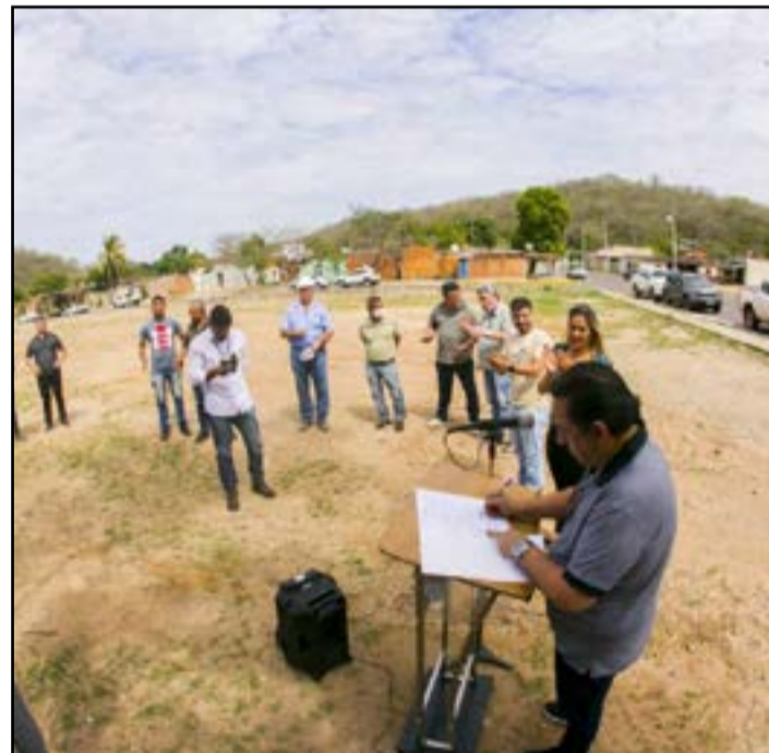
Obra vai urbanizar área no bairro Cravo Vermelho

“Quando investimos em um bairro, não podemos investir só na infraestrutura. Sabemos que é importante drenagem, galerias, acabar com alagamentos nas áreas afetadas; mas também, temos que trabalhar urbanização e paisagismo, somos uma cidade turística. Aqui para o Cravo Vermelho temos esse projeto, que