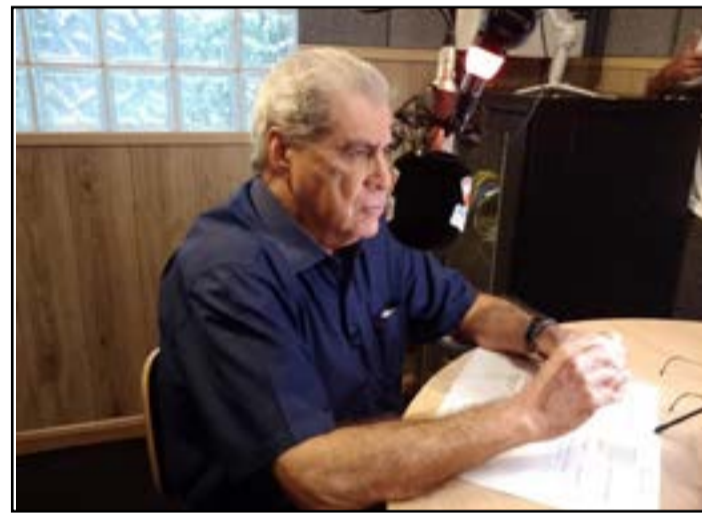
Candidato do MDB teve reunião com lideranças indígenas