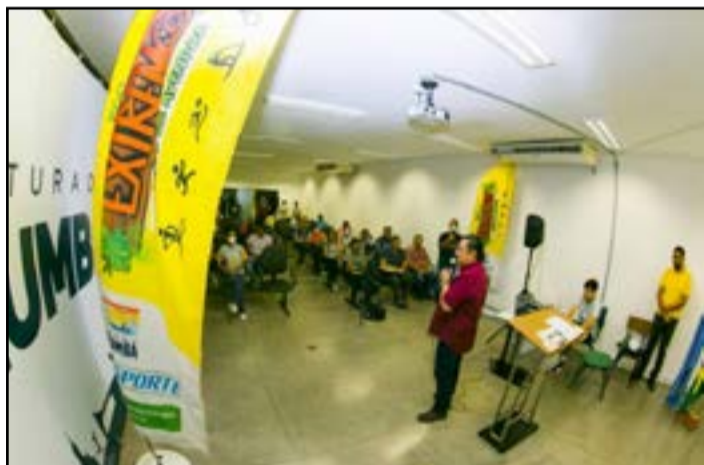
Expectativa é de participação de 1.400 atletas

O Eco Pantanal Extremo 2022 – Jogos de Aventura vai ser realizado de 11 a 13 de novembro em Corumbá. Com disputas de Tiro Prático; Maratona Aquática; Mountain Bike; Canoagem; Corrida de Trilha e Stand Up Paddle, a expectativa é de participação de 1.400 atletas. A premiação total é de R$ 70 mil e as inscrições terão início em outubro. O lançamento da competição aconteceu na manhã desta quarta-feira, 24 de agosto, durante cerimônia no auditório do Paço Municipal.