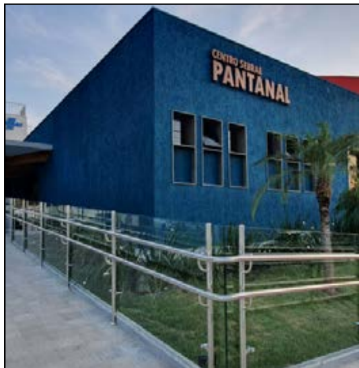
Unidade passa a ser referência na promoção de inovação e sustentabilidade dentro do bioma

Uma unidade de referência e com estrutura voltada para atuar na inovação e