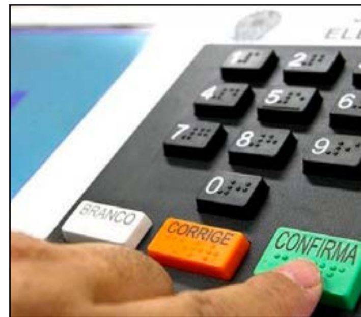
Alguns pontos foram extintos e eleitores já possuem novo local de votação

Com essa inauguração, Mato Grosso do Sul passará a contar com um segundo polo especializado do Sebrae. Em Bonito, já existe o Polo Sebrae de Ecoturismo, lançado em 18 de maio de 2022.