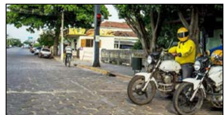
Cadastro ficará aberto até julho

A Autorização é intransferível, devendo ser renovada anualmente. No ato da renovação, será exigida a apresentação de