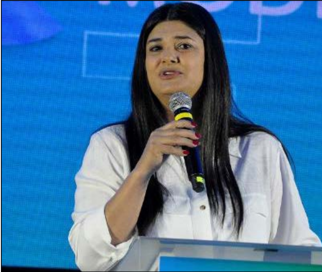
Para Rose, o momento atual é propício para ser a primeira mulher a alcançar o Governo do Estado