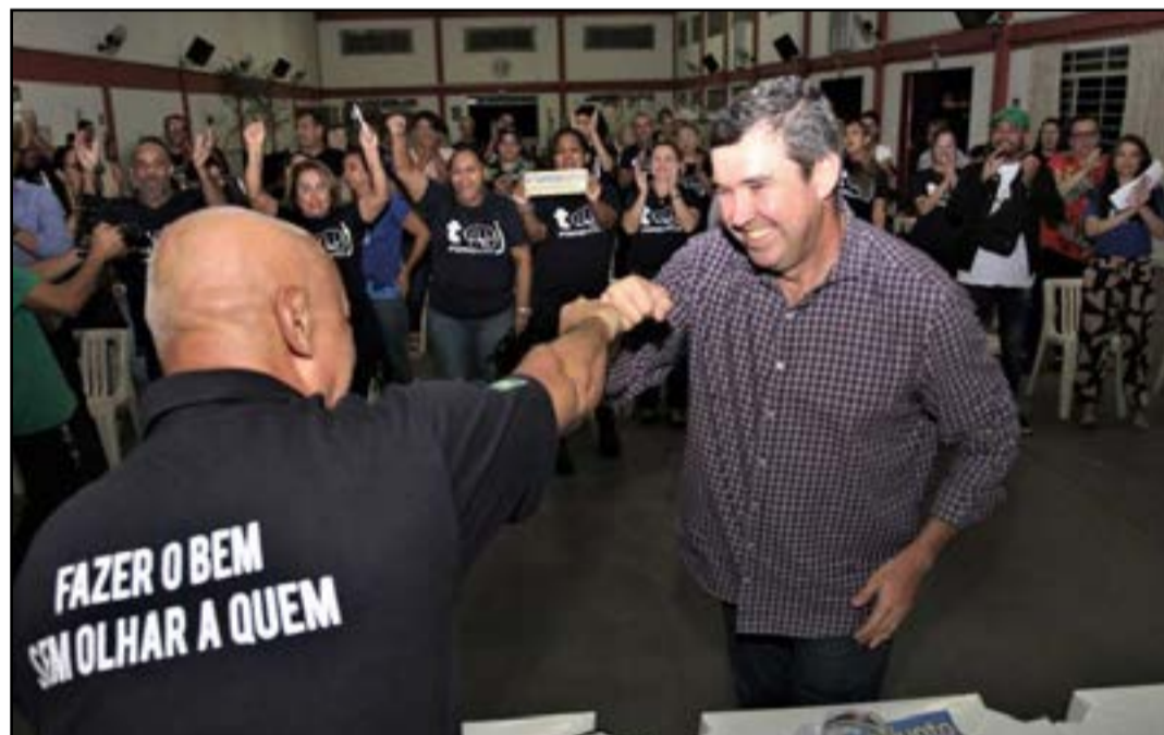
O ex-secretário de Infraestrutura iniciou sua pré-campanha na segunda-feira