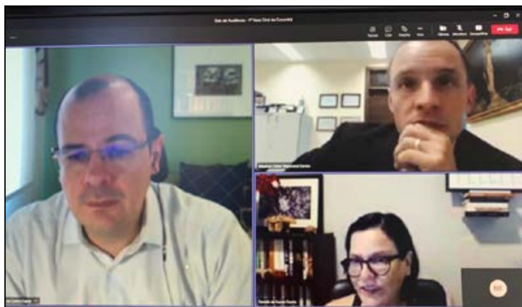
Videoconferência discutiu aprimoramento no fluxo de atendimentos e encaminhamentos

O juiz destacou que, na atualidade, a carência de autorização dos pais vem sendo suprida pela entrevista/escuta qualificada, bem como por meio de videochamadas com estes, sendo indispensável o cadastramento de tradutores, especialmente para as línguas “créole”, francês, árabe, libanês e espanhol -