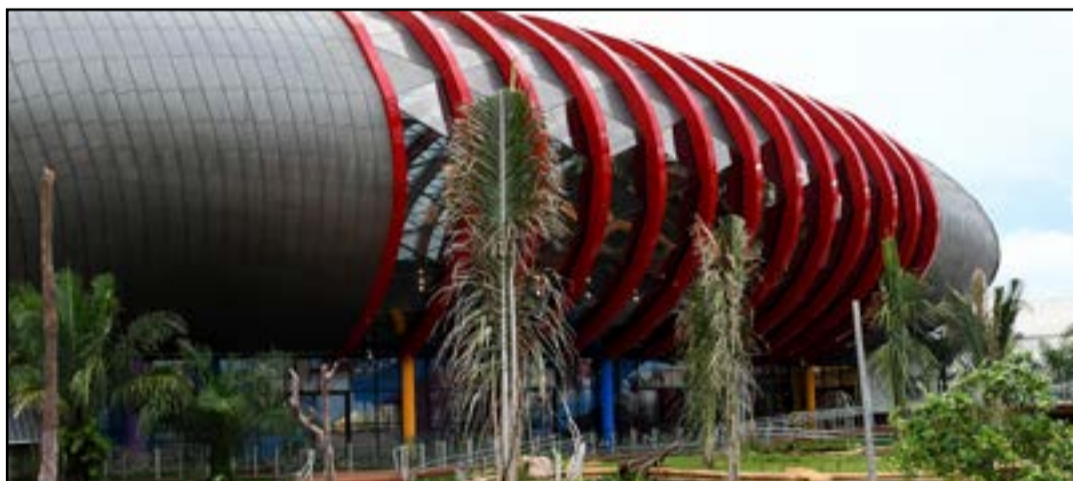
Bioparque deve atender de segunda a sexta-feira das 9h às 17h30 e sábado das 9h às 12h

Comunidades carentes e estudantes das escolas públicas serão prioridades nas visitas ao Bioparque Pantanal. A determinação do governador Reinaldo Azambuja é a forma encontrada para dar oportunidade para aqueles que não tem condições de pagar por um ingresso.