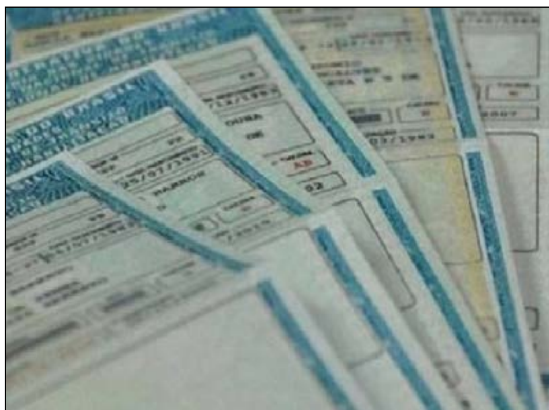
Previsão para divulgação do nome dos classificados é de 30 dias

Neste Edital as vagas serão disponibilizadas por