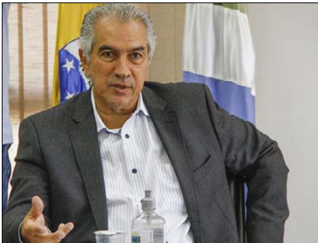
Governador Reinaldo Azambuja destacou força da economia sul-mato-grossense

Reformas estruturantes adotadas pelo Governo do Estado a partir de 2015 têm contribuindo até hoje para o crescimento da economia de Mato Grosso do Sul, que deve registrar alta de 1,6% no PIB (Produto Interno Bruto) só neste ano, conforme projeção da Tendências Consultoria.