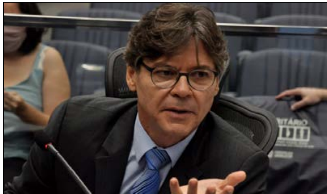
Deputado Paulo Duarte defende reavaliação dos valores das refeições do Restaurante Universitário da UFMS

as atividades relacionadas à operacionalização, comercialização, planejamento de cardápios, produção, transporte e distribuição das refeições para o Restaurante Universitário. O deputado Paulo Duarte considera de suma importância a reavaliação dos valores, pois leva “em consideração a finalidade e objetivo de uma instituição de ensino público federal presente no estatuto da UFMS que é assegurar a igualdade de condições de acesso e permanência dos estudantes na instituição”. As informações são da Agência ALEMS.