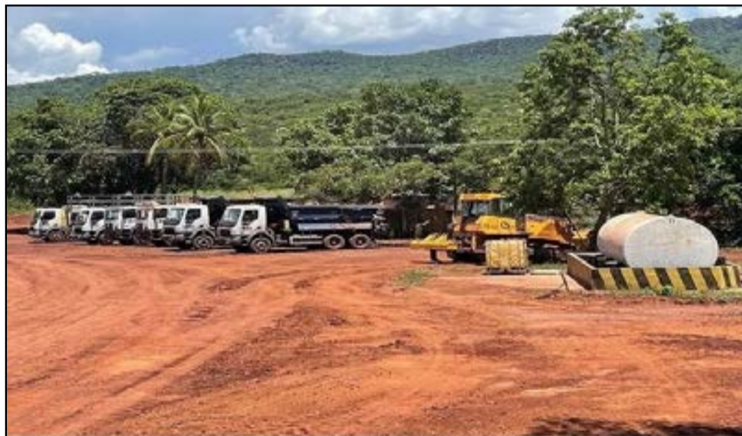
Mato Grosso do Sul tem potencial para ampliar a exploração mineral neste ano

Além do grande potencial mineral, a cadeia produtiva aposta na melhoria da logística com a retomada do processo de licitação da ferrovia Malha Oeste, que liga Corumbá a Mairinque em São Paulo e ainda o retorno de parte das atividades da hidrovía do Rio Paraguai. Prova da força do segmento é que três novas mineradoras estão se instalado no Estado. As mineradoras que estão chegando são a MPP/4B Mining e a 3A Mining em Corumbá e Ladário (ferro e Manganês) no Morro do Rabicho e no Morro Tromba dos Macacos. O