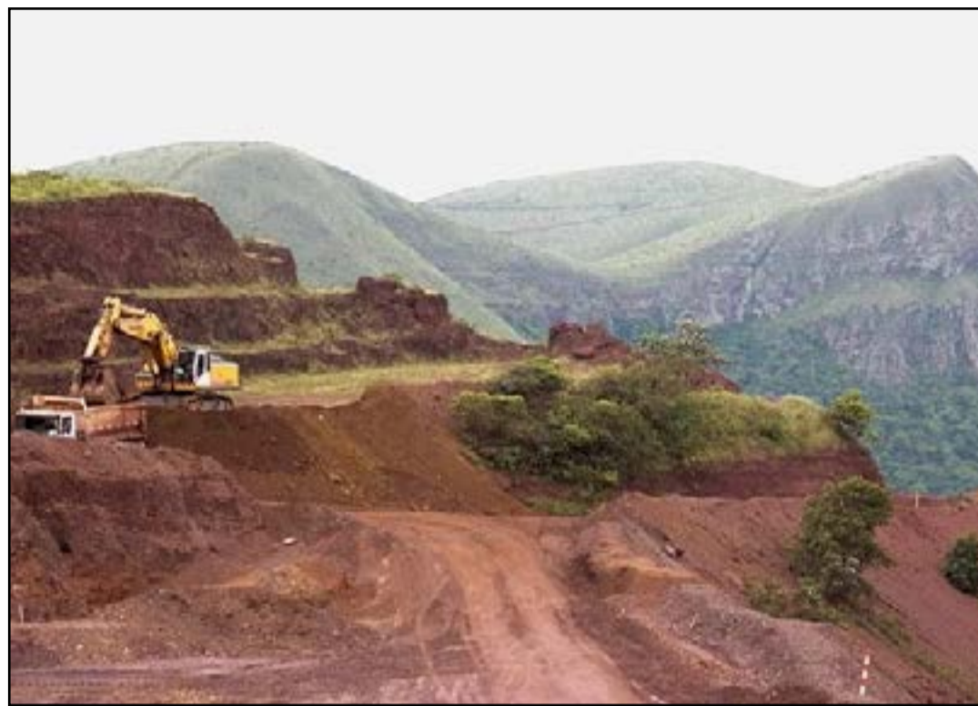
Vale transferir ao comprador as obrigações relacionadas aos contratos logísticos

Segundo o documento emitido pela Vale, a venda do Sistema Centro-Oeste, que produziu, em 2021, 2,7 milhões de toneladas de minério de ferro e 0,2 Mt de minério de manganês, está em linha com a estratégia da empresa, em simplificar o portfólio e focar nos principais negócios e oportunidades de crescimento, pautados pela alocação de capital disciplinada. As informações são do Portal do Governo de Mato Grosso do Sul.