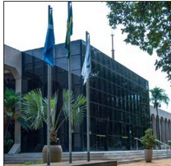
Data inicial para a entrega era 30 de março mas foi estendida

Acrescentou o capitão, bolsonarista de carteirinha: “Vai ser um grande desafio, mas com o apoio dos sul-mato-grossenses, estou pronto para a missão!”. As informações são do Correio do Estado.