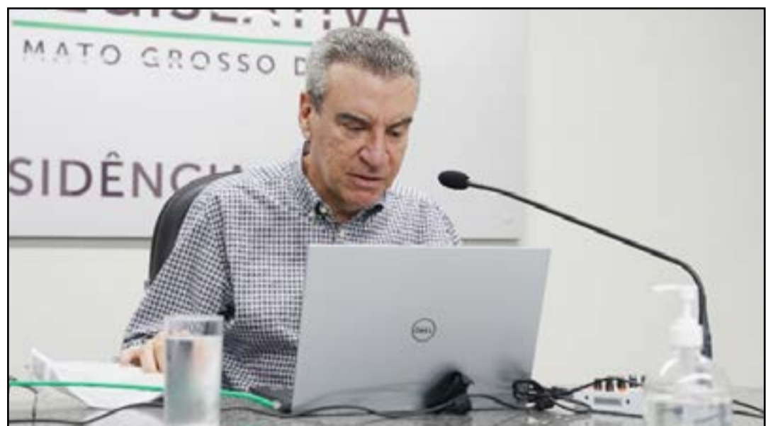
Implantação também incentivaria prática de atividades físicas

Corrêa citou o número considerável de ciclistas nas estradas, “movimento nunca antes visto”, e a necessidade de apresentar uma solução para evitar que acidentes aconteçam. “A gente faz a discussão de adequar aqui em Campo