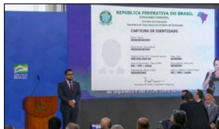
Documento terá CPF como número e contará com versão digital

“Gradativamente, deixaremos de ter uma carteira de identidade para cada estado. São 26 estados e o Distrito Federal, cada um com sua carteira. Isso vai acabar. Haverá uma identificação única do cidadão”, destacou o ministro Luiz Eduardo