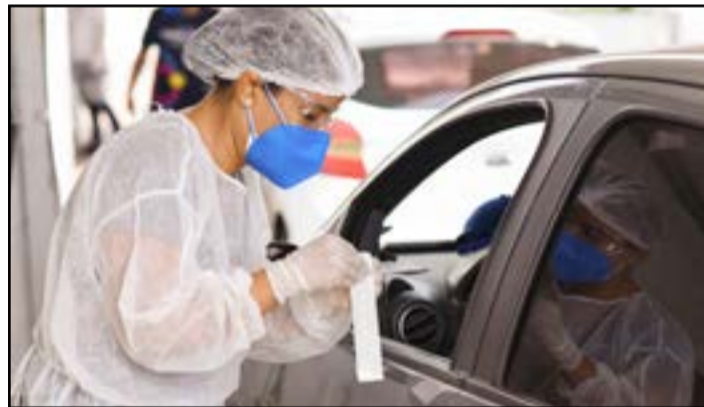
Drive-thru de testagem para Covid-19 da Casems em Campo Grande era o maior do estado

A força-tarefa entre a Casems e Secretaria de Estado de Saúde (SES) no drive-thru de testagem para Covid-19, em Campo Grande, finalizou os atendimentos com mais de 22 mil exames realizados. Desde o dia 15 de janeiro, o plano de