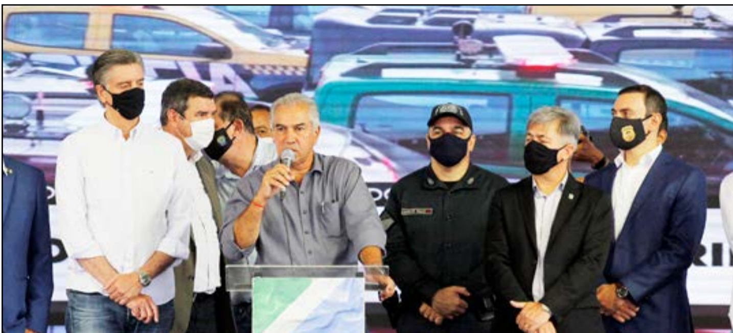
A entrega faz parte de uma parceria entre Governo Federal, Governo do Estado e recursos de emendas parlamentares.

Desde que assumiu a gestão estadual, em 2015, o governo Reinaldo Azambuja já investiu mais de R$ 750 milhões em equipamentos e viaturas para as forças de segurança do Estado. Na quinta-feira, dia 03, foram mais 237 novas viaturas e 115 fuzis, um investimento de R$ 44,5 milhões. PÁG.03