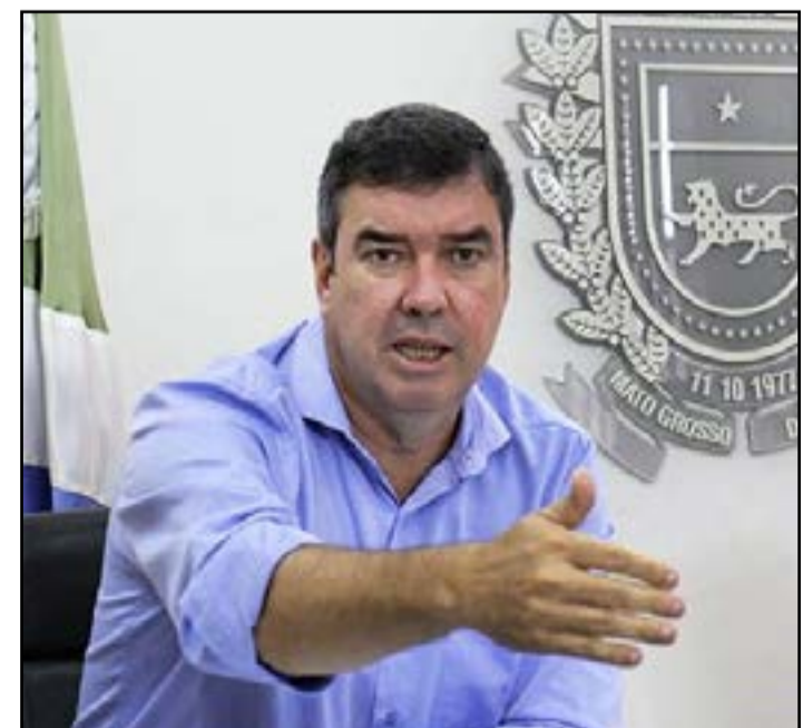
Secretário de Infraestrutura, Eduardo Riedel, é pré-candidato do PSDB ao Governo

A queda na taxa de desocupação decorre da disponibilidade de emprego em Mato Grosso do Sul. Sistemáticamente as análises apontam o agro, a indústria e outros setores contratando, o que desembocou em melhoria na taxa de desocupação. As informações são do Folha de Campo Grande.