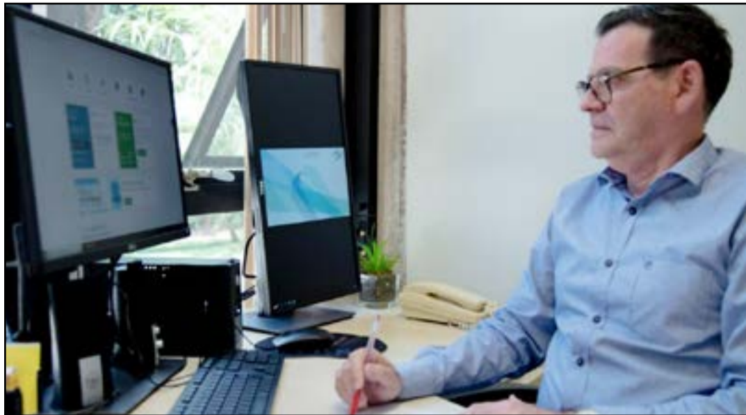
Curso, na modalidade à distância, é voltado para jurisdicionados, servidores do TCE e à sociedade em geral

Apresentar aos participantes os aspectos gerais e processos de planejamento em auditorias é o objetivo do curso que será disponibilizado pelo Tribunal de Contas de Mato Grosso do Sul, por meio da Escola Superior de Controle Externo, a partir do dia 8 de março.