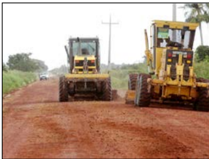
Agesul prossegue com a manutenção das estradas de revestimento no Pantanal, dentre as quais a MS-184

Do total de 17 pontes de madeira destruídas pelo fogo nos pantanais de Corumbá e Porto Murtinho, durante os incêndios florestais ocorridos em 2020 e 2021, o Governo do Estado já reconstruiu nove e está executando outras cinco, com recursos do Fundersul (Fundo de Desenvolvimento do Sistema Rodoviário de MS).